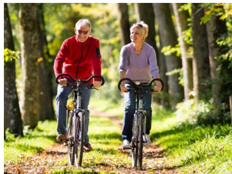
Freuen Sie sich auf entspannte Radtouren