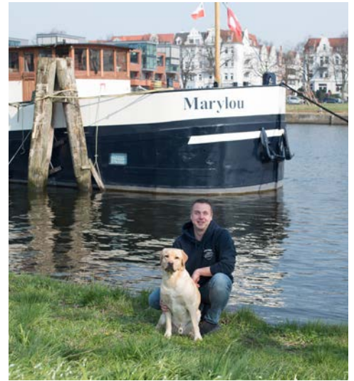
Ihr Kapitän mit Hund und Schiff