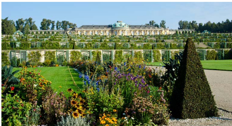
Schloss und Park Sanssouci werden Sie begeistern

Einige Stopps dienen der Ausflugsabwicklung.