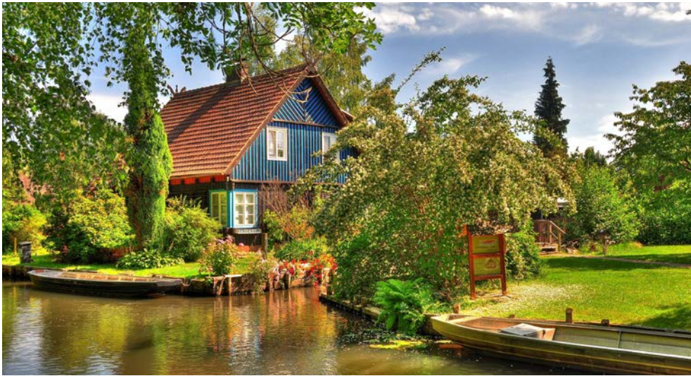
Traumhaft schön: der Spreewald