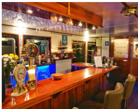
Maritimes Ambiente an Bord