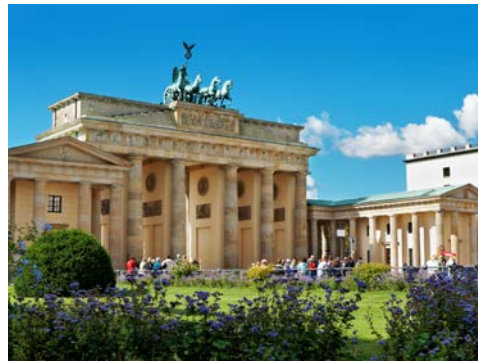
Das Brandenburger Tor am Pariser Platz in Berlin

Bereits am Morgen bringt Sie die MARYLOU zum Ausgangspunkt Ihrer Reise in Berlin-Spandau. Auch die schönste Reise geht einmal zu Ende. Nach der Ausschiffung Busfahrt zurück zum gebuchten Zustiegsort in Ostwestfalen.