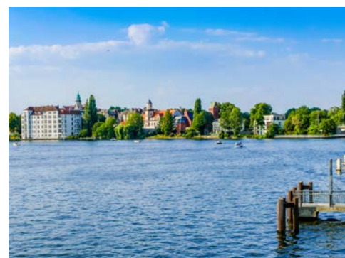
Impressionen am Müggelsee mit Blick auf Köpenick

Busfahrt vom gebuchten Zustiegsort in Ostwestfalen nach Berlin. Hier wartet die schöne MARYLOU am Nachmittag zur Einschiffung auf Sie. Ihr Kapitän und die Crew heißen Sie herzlich willkommen. Am Abend heißt es „Leinen los!“ Genießen Sie Ihre erste Dinner Cruise nach Potsdam.