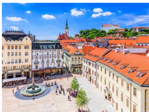
Wunderschön – Bratislava

Sehenswert ist das Stift von Engelhartszell, bekannt für die schön renovierte Kirche, aber auch für die „heilsamen“ Kräuterschnäpse. Hier beginnt die Radtour durch die romantische Flusslandschaft der Donauschlinge, einem der schönsten Donauabschnitte mit verträumten Dörfern am Fuße von saftig-grün bewaldeten Hängen. In Untermühl gehen Sie wieder an Bord und setzen die Reise per Schiff fort.