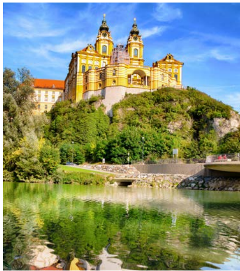
Das Stift Melk

Die sanfte Hügellandschaft, geprägt von verträumten Dörfern, Weinterrassen, Burgen, Klöstern und Ruinen hat noch jedermann verzaubert. Über dem Barockstädtchen Dürnstein thront der blaue