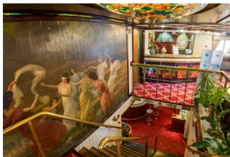
Einladende Lobby an Bord