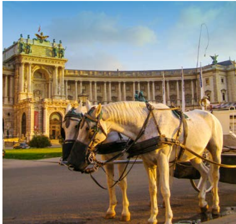
Kurze Verschnaufpause an der Hofburg in Wien

Die Radtour durch das Donauknie ist auch ein Ausflug in die Geschichte Ungarns. Vom ehemaligen Königssitz Visegrad radeln Sie durch die malerische, sanft hügelige Landschaft der Ungarischen Wachau bis nach Esztergom, wo die prachtvolle Basilika hoch über dem Burgviertel in den Himmel ragt. Zwei Fahrradrouten stehen zur Wahl: Die längere Variante beinhaltet einen Abstecher auf die Szentendre-Insel und in die Barockstadt Vác, die kürzere Tour führt direkt nach Esztergom. Nachts Weiterfahrt per Schiff nach Wien.