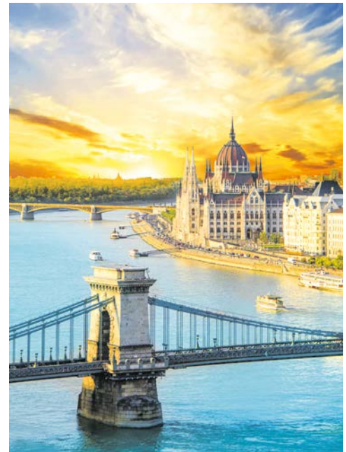
Budapest – Kettenbrücke und Parlament

Am Morgen erreichen Sie Devin. Entlang des einstigen Eisernen Vorhangs führt Ihr Radweg von der Burgruine Devin zum imposanten Schloss Hof und weiter nach Bratislava. Tipp: Fahrt mit dem Oldtimerzug durch die zauberhafte Altstadt. Genießen Sie von der Pressburg einen herrlichen Rundblick über die Hauptstadt der Slowakei. Nachts Schiffsfahrt von Bratislava nach Budapest.