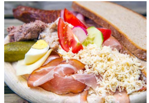
Nach einer Jause im Heurigen radelt es sich viel besser