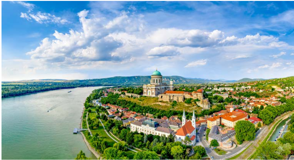
Esztergom am Donauknie