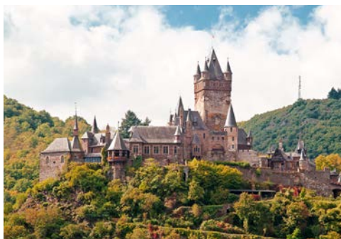
Die Reichsburg thront über Cochem

In Köln endet Ihre erlebnisreiche Flussreise auf Rhein und Mosel.