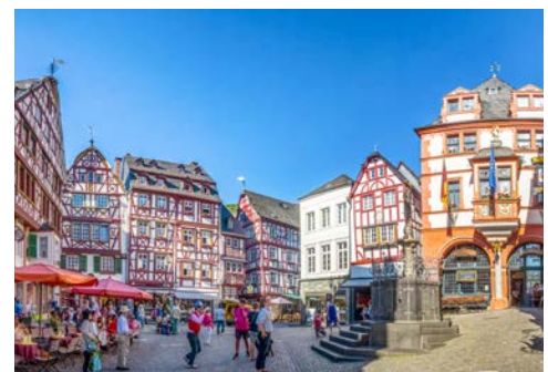
Der Marktplatz von Bernkastel-Kues

Direkt in einer Moselschleife gelegen besticht Traben Trarbach mit einem wunderschönen Panorama. Über der Stadt thronen die Mauern der 1350 erbauten Grevenburg von der nach 1734 nur noch Ruinen übrig geblieben sind. Ihre Weiterfahrt führt Sie nach Bernkastel-Kues, ein wahres Kleinod an der Mosel. Klein und fein, trägt der Ort trotzdem einen so großen Beinamen wie „Internationale Stadt der Rebe und des Weines“. Nutzen Sie die Gelegenheit und probieren Sie hervorragende Weine direkt vor Ort beim Winzer! Sie finden hier auch ein Weinmuseum. Doch Bernkastel hat noch mehr zu bieten: Sie besuchen eine Stadt, in der schon die Römer ihre Spuren hinterließen. Schlendern Sie über den wunderschönen Marktplatz, vorbei an stolzen Fachwerk-Häusern, und besichtigen Sie das Geburtshaus von Nikolaus von Kues.