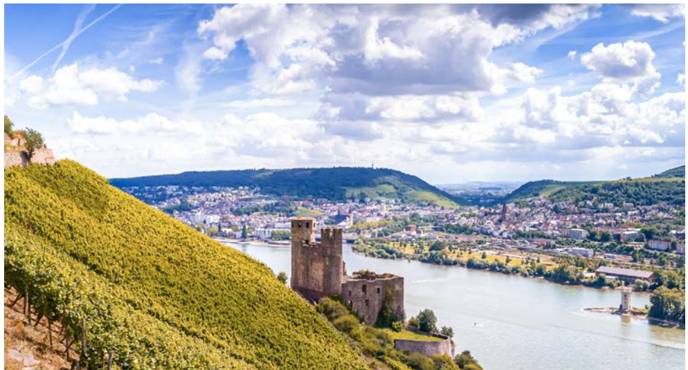
Burg Ehrenfels bei Rüdesheim