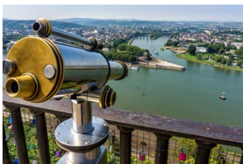
Blick auf das Deutsche Eck

Erleben Sie die unvergleichliche Mosel-Atmosphäre zunächst noch einmal in Bernkastel-Kues – vielleicht bei einem Spaziergang entlang des weitläufigen Moselufers. Anschließend bringt Sie Ihr Schiff weiter nach Cochem, ein verträumtes Städtchen mit verwinkelten Gassen und liebevoll restaurierten Fachwerkhäusern. Lohnenswert ist ein gemütlicher Spaziergang durch das viel besuchte Weinstädtchen. Die zahlreichen gut erhaltenen Reste der historischen Stadtmauer mit ihren alten Befestigungswerken zeugen noch heute von der belebten Vergangenheit.