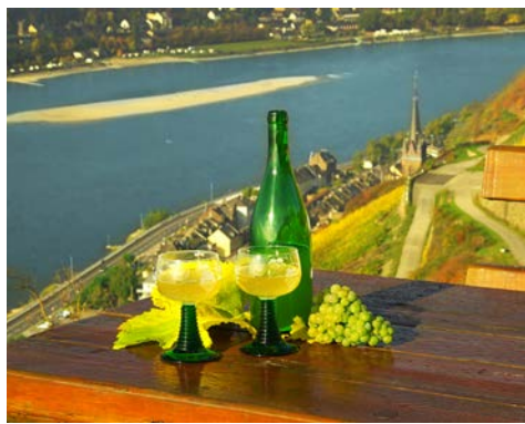
Herzlich Willkommen im Weinanbaugebiet Rhein-Mosel!