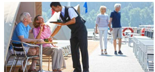
Herzlicher Service ...

Programmänderungen vorbehalten. An- und Abreisetag dienen ausschließlich der Erbringung der vertraglichen Beförderungsleistungen. Stand 03/21 – alle Angaben ohne Gewähr.