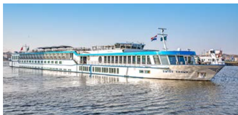
... an Bord der SWISS CROWN

Die SWISS CROWN gehört zu den beliebtesten Schiffen auf Europas Flüssen und überzeugt durch ein sehr durchdachtes Konzept. Im Winter 2019/20 wurde sie sehr aufwändig renoviert und verfügt über eine zeitgemäße Ausstattung. Die Kabinen, ca. 16m 2 groß, verteilen sich auf drei Decks. Das Sonnendeck und die Panorama-Lounge laden