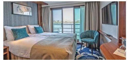
Komfortable Kabinen, z.B. auf dem Diamantdeck