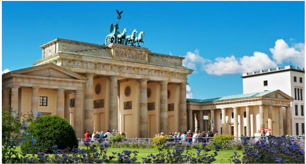
Das Brandenburger Tor am Pariser Platz