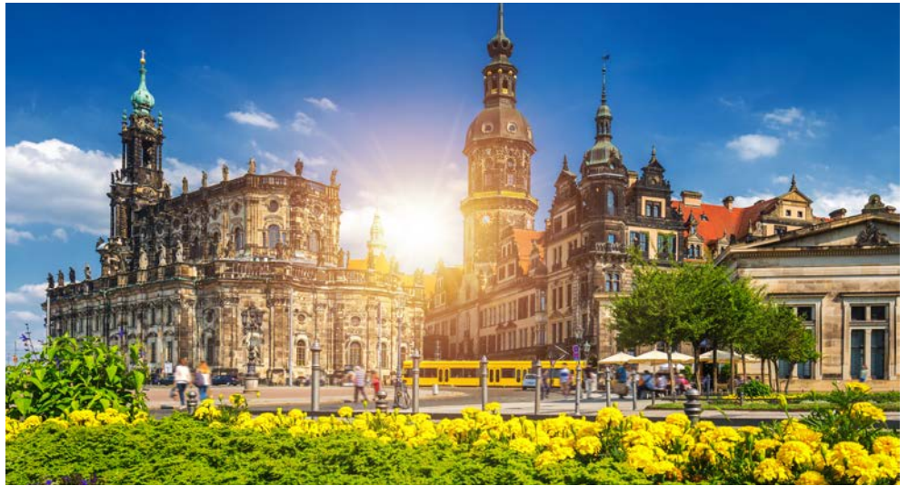
Altstadt-Silhouette von Dresden

Lustgarten und das Schlossmuseum, bei der Sie unter anderem die königliche Hofküche, den Kuppelsaal und die katholische Kapelle entdecken. Das Ensemble aus Architektur und Gartenkunst gilt dank seiner Vielfältigkeit als perfektes Ausflugsziel für Kultur- und Gartenliebhaber. Zurück nach Dresden geht es mit dem Bus.