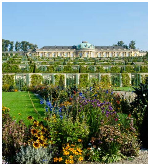
Sommerliche Park-Anlage von Sanssouci

Am Abend erleben Sie die Metropole Berlin vom Wasser aus in einem ganz neuen Licht. Die Cityfahrt beginnt am Anleger Friedrichstraße und führt an den zahlreichen Highlights der Stadt vorbei. Lauschen Sie dabei den interessanten Informationen, die via Bordlautsprecher bekannt gegeben werden und genießen Sie ein prickelndes Glas Sekt sowie eine typische Berliner Bulette mit Kartoffelsalat.