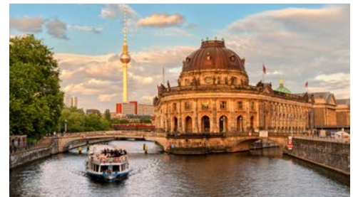
Blick auf das Bode-Museum