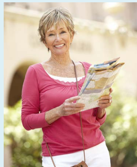
Sommerliches Städtevergnügen auf beiden Reisen

Hotel- und Programmänderungen vorbehalten. An- und Abreisetag dienen ausschließlich der Erbringung der vertraglichen Beförderungsleistungen. Stand 03/21 - alle Angaben ohne Gewähr.