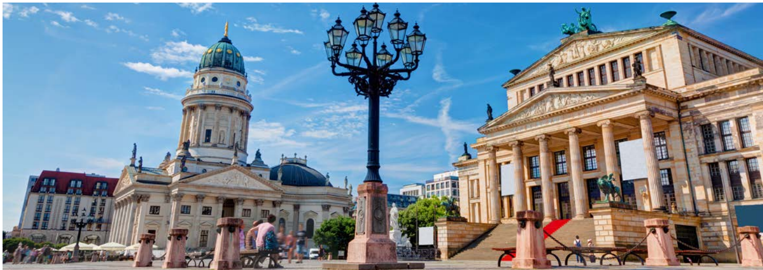
Unverkennbar – der Gendarmenmarkt in Berlin