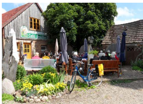
Eine kurze Pause zwischendurch

Durch das Ruppiner Seengebiet führt der gut ausgebaut Radweg Richtung Norden nach Oranienburg. Sehenswert: das Barockschloss mit Park, Museum und Orangerie. Hier gehen Sie wieder an Bord und fahren bis nach Eberswalde. Im Herzen der Stadt, im Finowkanal, befindet sich die älteste betriebsfähige Schleuse Deutschlands, die seit 1978 ein technisches Denkmal ist.