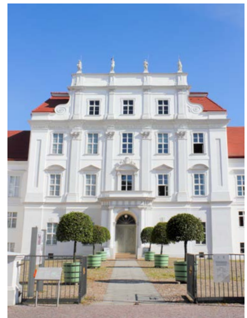
Barockschloss in Oranienburg