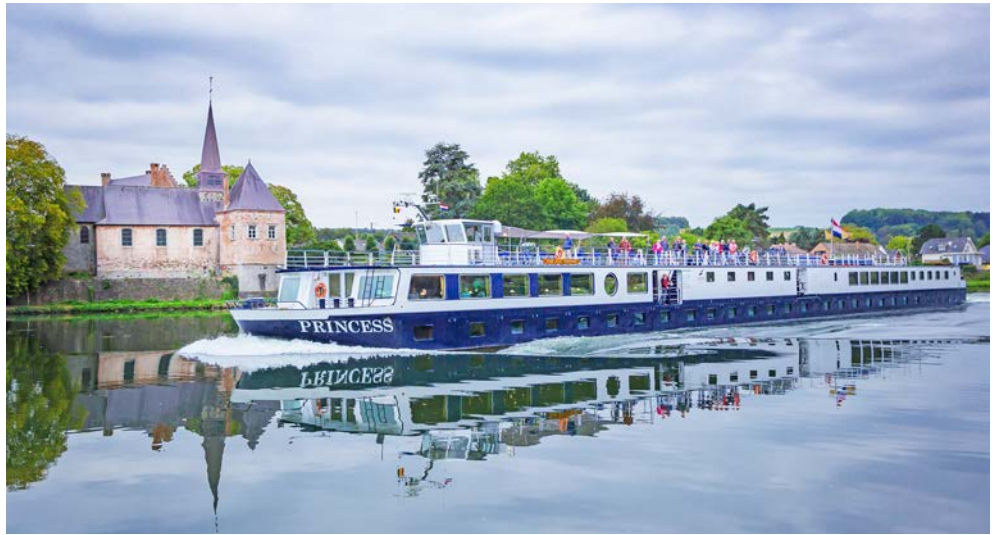
Die PRINCESS erwartet Sie

Was kann wohl schöner sein als auf Radtouren viel Interessantes über Land und Leute, Kultur und Natur zu erfahren und im Anschluss wieder auf ein „schwimmendes Hotel“ zu gehen? Entdecken Sie die vielfältige Flora und Fauna dieser einzigartigen Flusslandschaften, barocke Schlösser, Backsteingotik und norddeutsche Bäderarchitektur.