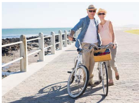
Ihre Radtour kann beginnen