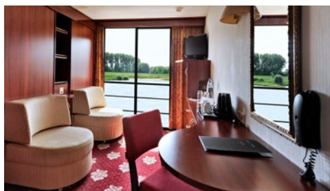
Kabinenbeispiel mit frz. Balkon

Optisch ähnelt die CRUCEVITA einer Yacht. Sie verfügt zwar über einen luxuriösen Look, versprüht dabei aber ein gemütliches Flair. Erbaut wurde das Schiff 1995, im Jahr 2019 erhielt es eine umfassende Renovierung. Den maximal 110 Passagieren stehen zwei Kabinendecks und ein Sonnendeck beim Aufenthalt auf dem Schiff zur Verfügung. Hier lässt sich das einmalige Flair auf dem Fluss erleben.