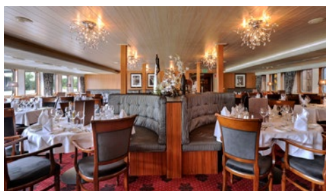
Gepflegte Gastlichkeit im Restaurant