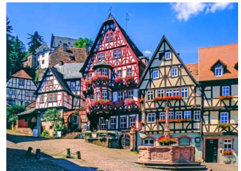
Marktplatz von Miltenberg

umsäumt. Von hier blickt man hinab auf die alte Universitätsstadt mit ihren Kuppeln, Türmen und Brücken.