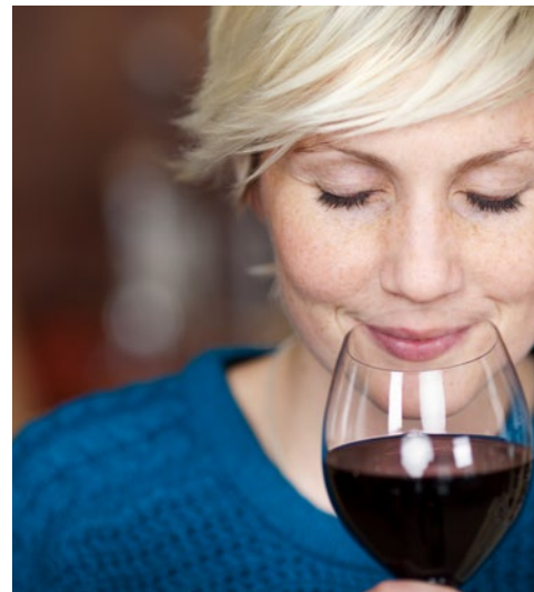
Wie wäre es mit einer Weinprobe?

Bereits in der Nacht hat die CRUCEVITA die Gutenbergstadt Mainz erreicht. Nach dem Frühstück erfolgt die Ausschiffung. Heimreise wie gebucht.