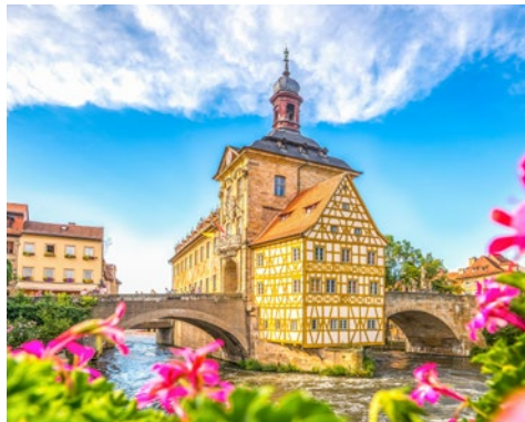
Bamberg lohnt mehr als einen Blick

Anreise wie gebucht. In der zweitgrößten Stadt Bayerns, die am Ufer der Pegnitz und am Rhein-Main-Donaukanal gelegen ist, erwartet Sie die CRUCEVITA bereits zur Einschiffung.