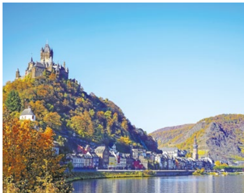
Die Reichsburg thront über Cochem

In Rüdesheim reiht sich Sehenswertes an Sehenswertes. Kirchen, Burgen, sogar ein Schloss – und Museen, zum Beispiel Siegfrieds Mechanisches Musikkabinett mit einer der größten Sammlungen selbstspielender Musikinstrumente. Selbstverständlich ist die Drosselgasse ein Muss. Doch auch sonst wartet hinter jeder Ecke hier ein hübsches Café, ein Restaurant oder eine Straußwirtschaft. Vielleicht fahren Sie mit dem Winzerexpress hinauf in die Weinberge, oder Sie bewundern vom Niederwalddenkmal aus die fantastische Aussicht. Am späten Nachmittag bringt Sie die CRUCEVITA zu Ihrem Übernachtungs-Liegeplatz in Alken.