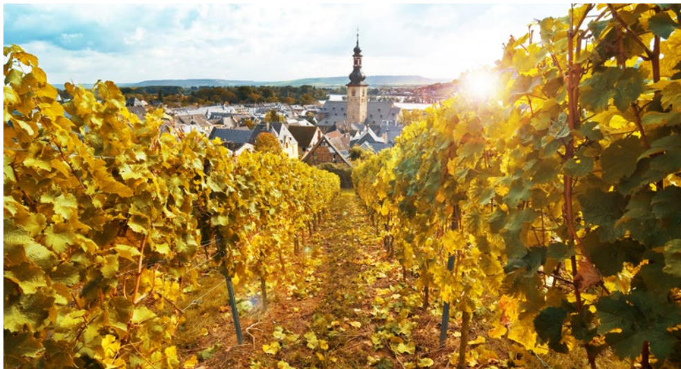
Rüdesheim wird Sie verzaubern