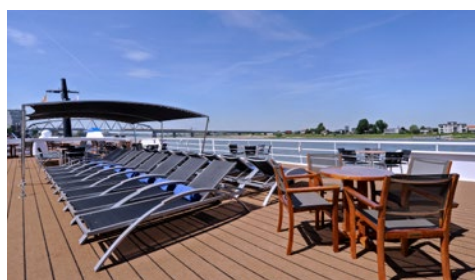
Auf dem Sonnendeck

Kleidungsempfehlung: Tagsüber sportlich-leger und bequem. Zum Abendessen ist gepflegte Kleidung erwünscht, zum Kapitänsdinner ist sportlich-elegante Garderobe angebracht.