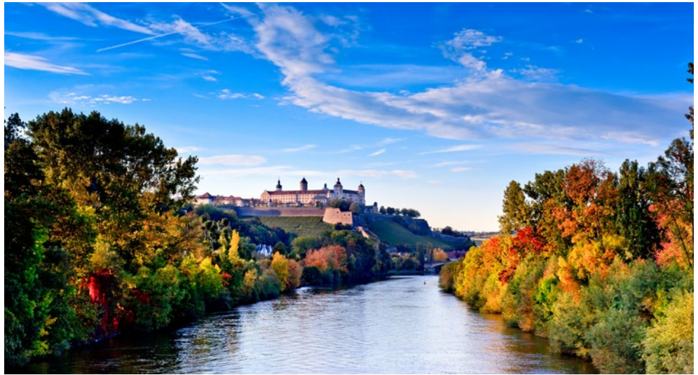
Romantischer Blick auf Würzburg