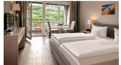
Westerland: Dorint Strandresort und Spa, Zimmerbeispiel