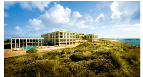
List: Superior A-ROSA Hotel Sylt