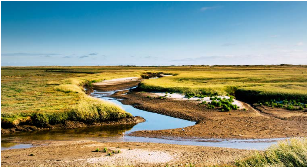
St Peter Ording, Priel

Traditionelle Pfahlbauten, kilometerweiter Strand, einzigartige Dünenlandschaften, sausende Strandsegler – das ist ein Bild, das man von St. Peter-Ording, der „größten und schönsten Sandkiste Europas“ im Kopf hat. Gelegen an der westlichen Spitze der Halbinsel Eiderstedt, lockt die Ortschaft mit einer beeindruckenden Naturkulisse, die bereits unzählige Künstler, Geschichtenerzähler und natürlich auch Urlauber inspirierte. Tauchen auch Sie ein in diese einzigartige Atmosphäre und genießen Sie eine Brise frische Seeluft.