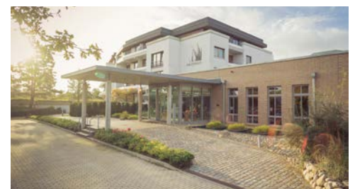
St. Peter-Ording: AALERNHÜS Hotel & Spa