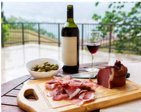
Schon probiert? Der berühmte Schinken von Njegos.

Nach einer kurzen Kaffeepause unternehmen Sie eine traumhafte Schiffsfahrt in der Bucht von Kotor, welche Sie zur Klosterinsel Maria am Felsen und weiter nach Perast führt, ein altes Seefahrerstädtchen mit charakteristischen Bürgerhäusern, Kirchen und Kapellen. Anschließend Rückfahrt zum Hotel.