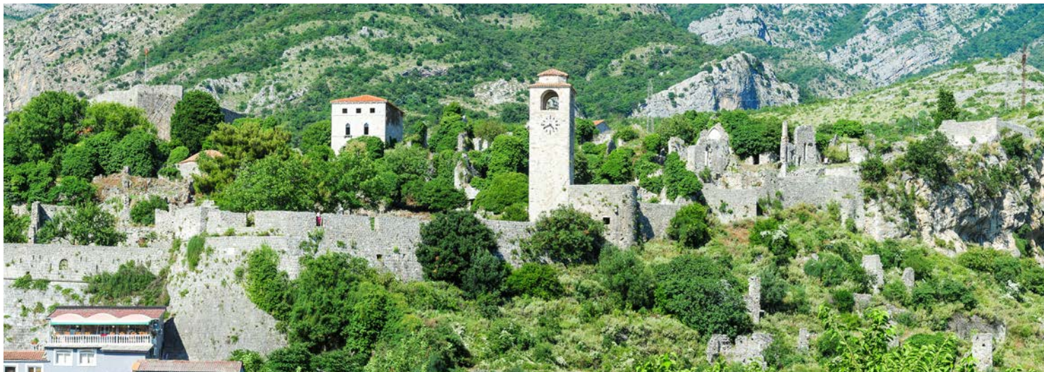
Stari Bar - die historische Altstadt von Bar

Insel, die heute jedoch durch eine Sandbank mit dem Festland verbunden ist. Wie andere Städte der Region wurde auch Budva weitgehend bei einem Erdbeben 1979 zerstört, aber anschließend originalgetreu wieder aufgebaut.