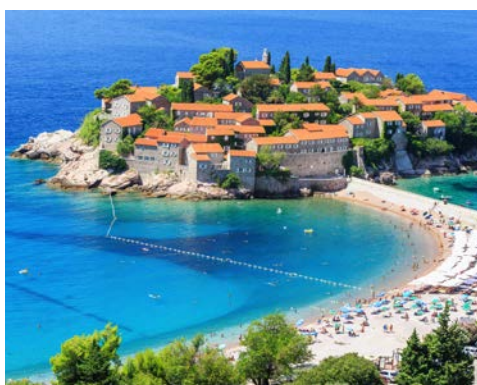
Blick auf Sveti Stefan bei Budva

Ihr Ausflug führt Sie heute in den Süden des Landes. Ihr erster Stopp ist die Hafenstadt Bar. Die historische Altstadt, Stari Bar, ist heute nicht viel mehr als eine Ruinenstadt, dennoch zählt sie zu den kulturhistorisch wertvollsten Stätten Montenegros. Im südlichsten Adria-Zipfel von Montenegro lockt die Insel Ada Bojana, ein kleines Paradies inmitten der Mündung des Flusses Bojana. Danach besuchen Sie die südlichste Stadt Montenegros, Ulcinj. Mythen und Legenden erzählen von Piraten und Sklavenhändlern. So soll der spanische Dichter Miguel Cervantes als Sklave in Ulcinj inhaftiert gewesen sein und Inspiration für sein Werk „Don Quijote“ gesammelt haben.