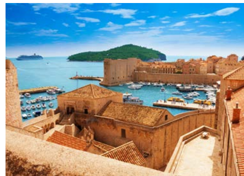
Trutzig beschützt die Stadtmauer Dubrovniks Altstadt