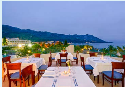
Schöne Aussichten von der Hotelterrasse

Das Hotel verfügt über 578 Zimmer , die sich auf drei Gebäude verteilen. Diese sind ausgestattet mit Bad oder Dusche/WC, Haartrockner, Mietsafe, Sat.-TV, WLAN und Klimaanlage. Weitere Einrichtungen: Buffetrestaurants, Bars und Souvenirshop. Mehr als 40.000 Quadratmeter Gartenfläche warten auf Sie. Hier befinden sich zwei Swimmingpools mit Sonnenterrasse und Poolbar. Liegen und Sonnenschirme sind an den Pools inklusive (am Strand gegen Gebühr), Badetücher gegen Kaution erhältlich.