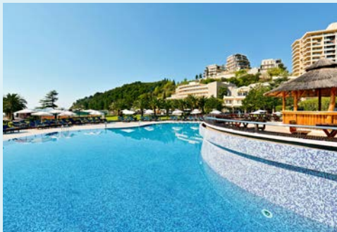
Die großzügige Poolanlage

Ihr Hotel Iberostar Bellevue (Landeskategorie: 4 Sterne) befindet sich im hübschen Urlaubsort Becici, etwa 2 km von Budva entfernt. Es liegt perfekt zwischen den dicht bewachsenen Bergen des Balkans und der Adria. Die Naturschönheiten der Region sind für Sie fast zum Greifen nah – das Meer können Sie sogar über einen direkten Zugang vom Hotel erreichen. Die Lage ist ideal: Hier, wo sich das satte Grün der mit Bäumen bewachsenen Berge und das leuchtende Blau der Adria an einem einzigen Ort vermischen, befindet sich Ihr montenegrinisches Urlaubsparadies.