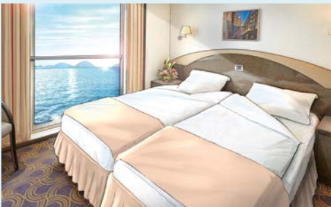
Kategorie 10 mit Infinity Fenster (Modellbild)

Die HAMBURG ist eine Besonderheit auf dem Kreuzfahrtmarkt - egal, wohin Sie möchten, die HAMBURG bringt Sie hin! Die Routen sind wirklich außergewöhnlich. Ihr Lieblingsschiff kommt dorthin, wo andere kapitulieren müssen. Und wo es selbst der HAMBURG zu eng wird, steigen Sie einfach um. Die bordeigenen Zodiacs machen nahezu Unmögliches möglich und so manche Kreuzfahrt zur spannenden Expedition. Genauso individuell wie die Reiserouten ist das Schiff selbst. Klein, aber fein. Komfortabel, aber leger. Stilvoll, aber lebendig. Deutschsprachig, aber weltoffen. Auf der HAMBURG gibt es kein Entweder-Oder, sondern immer nur Sowohl-Als-Auch! Eine vertraute Atmosphäre an Bord, helle Kabinen, teilweise im April 2020 modernisierte und schöne Gesellschaftsräume sorgen rundum für Wohlbefinden, ganz ohne Hektik und Menschenmassen. An Bord genießen Sie eine gelebte Gastfreundschaft, wie sie nur auf Schiffen mit höchstens 400 Gästen möglich ist, und einen freundlichen Service, der Ihre persönlichen Wünsche in den Mittelpunkt stellt. Von morgens bis abends bietet Ihnen das Schiff viel Entspannung und Abwechslung, damit kein Tag dem anderen gleicht. Und das Beste: ab Mai 2020 erstrahlt Sie im neuen Glanz und bietet Ihnen noch mehr Komfort.