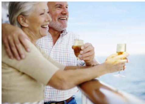
Genießen Sie Ihre Zeit an Bord

Sie erhalten Ihre Kabinenummer mit den Reiseunterlagen. Vorteilspreis gültig für ein limitiertes Kontingent. TOP = Der Veranstalter wählt die Kabine, Sie sparen. *teilw. Sichtbehinderung, auf Deck 4 versperren Rettungsboote die Sicht.