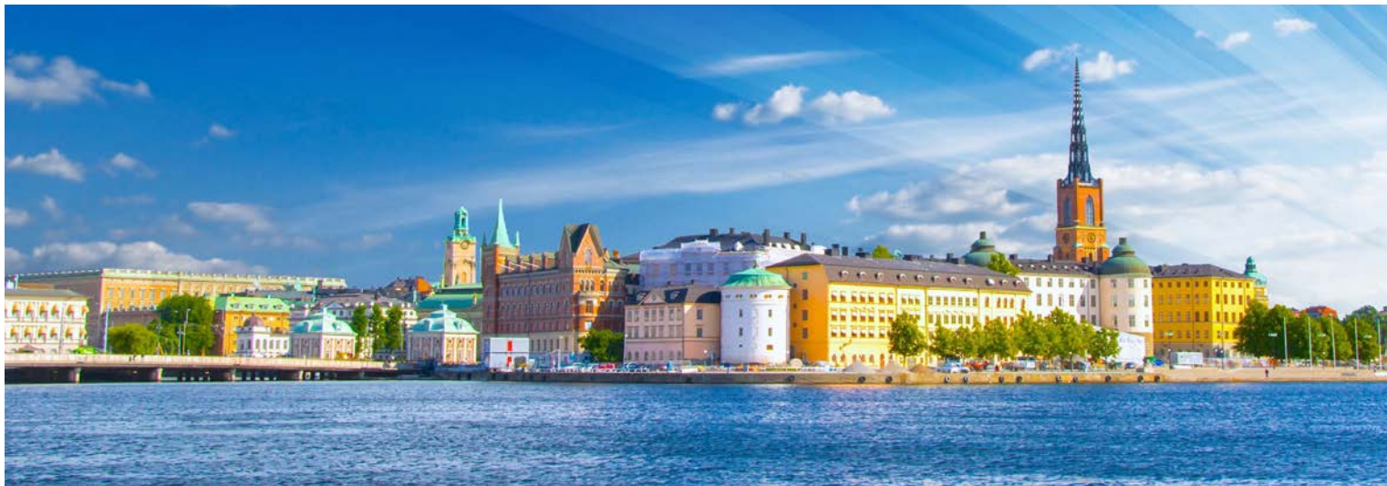
Gamla Stan – Die Altstadt von Stockholm

ist fast schon ein Muss. Puschkin mit dem prächtigen Katharinenpalast und dem legendären Bernsteinzimmer sind weitere Ausflugshöhepunkte.