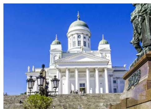
Domkirche in Helsinki